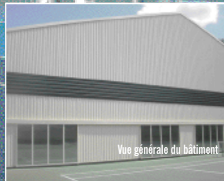
Vue générale du bâtiment

A l'issue d'une patiente réflexion, le centre de ligue de Bourgogne s'est équipé de deux courts couverts supplémentaires. L'objectif principal étant de pallier le manque d'équipements dans l'agglomération dijonnaise. Témoignages des principaux acteurs.