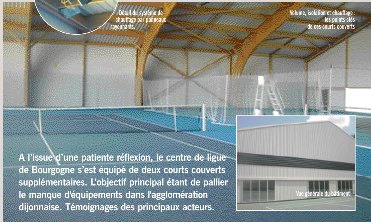
Volume, isolation et chauffage : les points clés de ces courts couverts

A l'issue d'une patiente réflexion, le centre de ligue de Bourgogne s'est équipé de deux courts couverts supplémentaires. L'objectif principal étant de pallier le manque d'équipements dans l'agglomération dijonnaise. Témoignages des principaux acteurs.