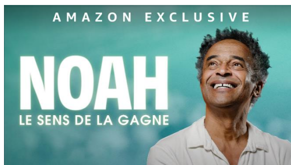
Visuel téléchargeable libre de droits

En préambule de la finale du simple messieurs, un documentaire sur Yannick Noah, intitulé « Le sens de la gagne », sera diffusé à 13h00, en avant-première, sur l'écran-géant installé dans les tribunes du court Suzanne-Lenglen, grâce à BNP Paribas. Ce film, où le vainqueur de Roland-Garros 1983 revient notamment sur son parcours et sa culture de la gagne, sera disponible en exclusivité sur Prime Video à partir du 20 juin.